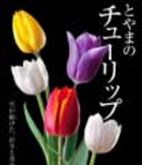
とやまの チューリップ