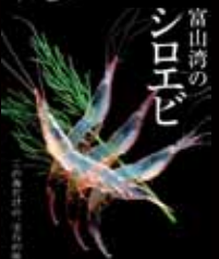
富山湾の シロエビ