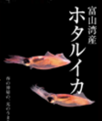
富山湾産 ホタルイカ